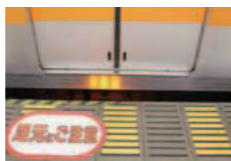
転落防止警報装置

ホームと電車の乗降口との間が広い場所では、お客様の転落を防止するために、高輝度LED点滅や警報音声による転落防止警報装置が設置されています。