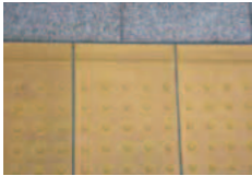
ホーム縁端警告ブロック

目の不自由なお客様が、ホームから転落することを防止するため、ホームの内側を示す内方線と点状ブロックが一体となったものがホーム縁端部に設置されています。