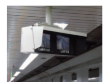
ホーム監視用モニター

お客様が電車を乗り降りする際や、電車が駅から出発する際に、乗務員および駅係員がお客様の安全を確認するために、死角をカバーするモニターが設置されています。