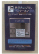
駅係員よびだしインターホン

線路への落とし物や、不審物の発見など、お客様が緊急に駅係員に連絡したい場合に回答できるよう、ホームに駅係員よびだしインターホンが設置されています。